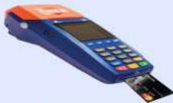
EDC Mini ATM BRI