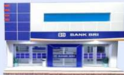
Kantor BRI (Teller)